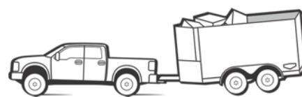
Zu viel Stützlast vermeiden