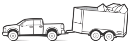
Zu wenig Stützlast vermeiden

Wichtig: Die gesetzlichen Vorgaben, sowie die technischen Limitationen aller Komponenten sind jederzeit einzuhalten.